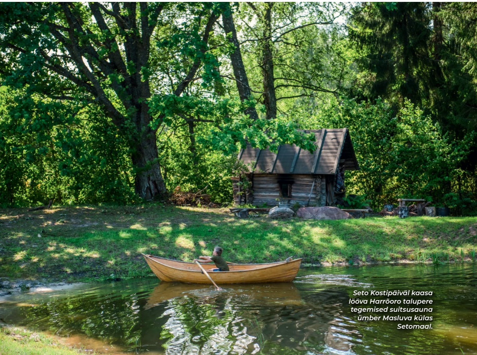
Seto Kostipäivil kaasa lööva Harrõoro talupere tegemised suitsusauna ümbert Masluva külas Setomaal.