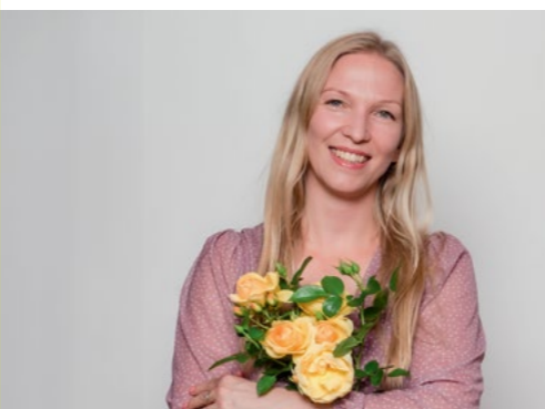
Maritta Pillaroo Roosifestival Kaagjärvel (27.07)