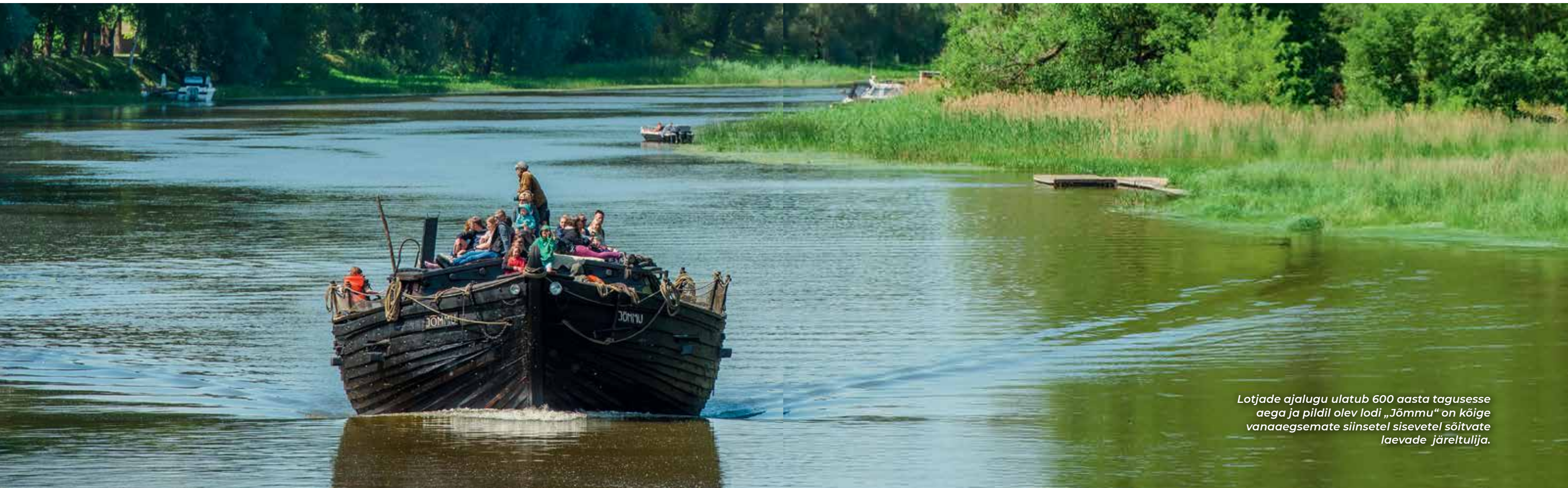
Lotjade ajalugu ulatub 600 aasta tagusesse aega ja pildil olev lodi „Jõmmu“ on kõige vanaaegsemate siinsetel sisevetel sõitvate laevade järeltulija.

Euroopa kultuuripealinn Tartu 2024 programm on rikkalik ja mitmekülgne, hõlmates väga erineva iseloomuga sündmuseid erinevate huvidega inimestele. Kultuuripealinna põhiprogrammi raamidesse mahtuv Lõuna-Eesti kogukonnaprogramm rikastab muuhulgas elamustega, mis põimivad looduse ja kultuuri ühtseks kogemuslikuks rännakuks. Selliseid sündmuseid on tulekul päris mitu, seejuures sisukuselt ei jää need üksteisele kuidagi alla.