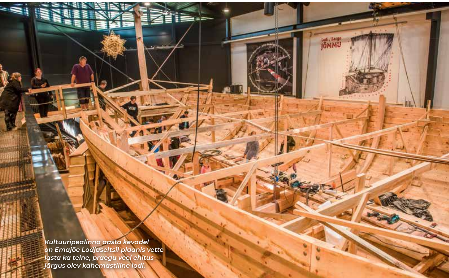
Kultuuripealinna aasta kevadel on Emajõe Lodjaseltsil plaanis vette lasta ka teine, praegu veel ehitusjärgus olev kahemastiline lodi.