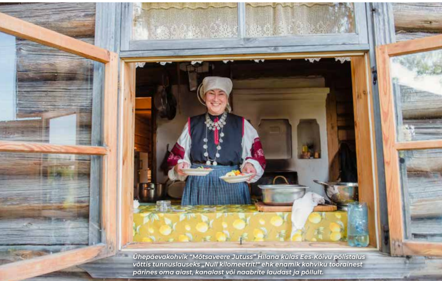
Ühepäevakohvik "Mõtsaveere Jutuss" Hilana külas Ees-Kõivu põlistalus võttis tunnuslauseks „Null kilomeetrit!“ ehk enamik kohviku toorainest pärines oma aiast, kanalast või naabrite laudast ja põllult.