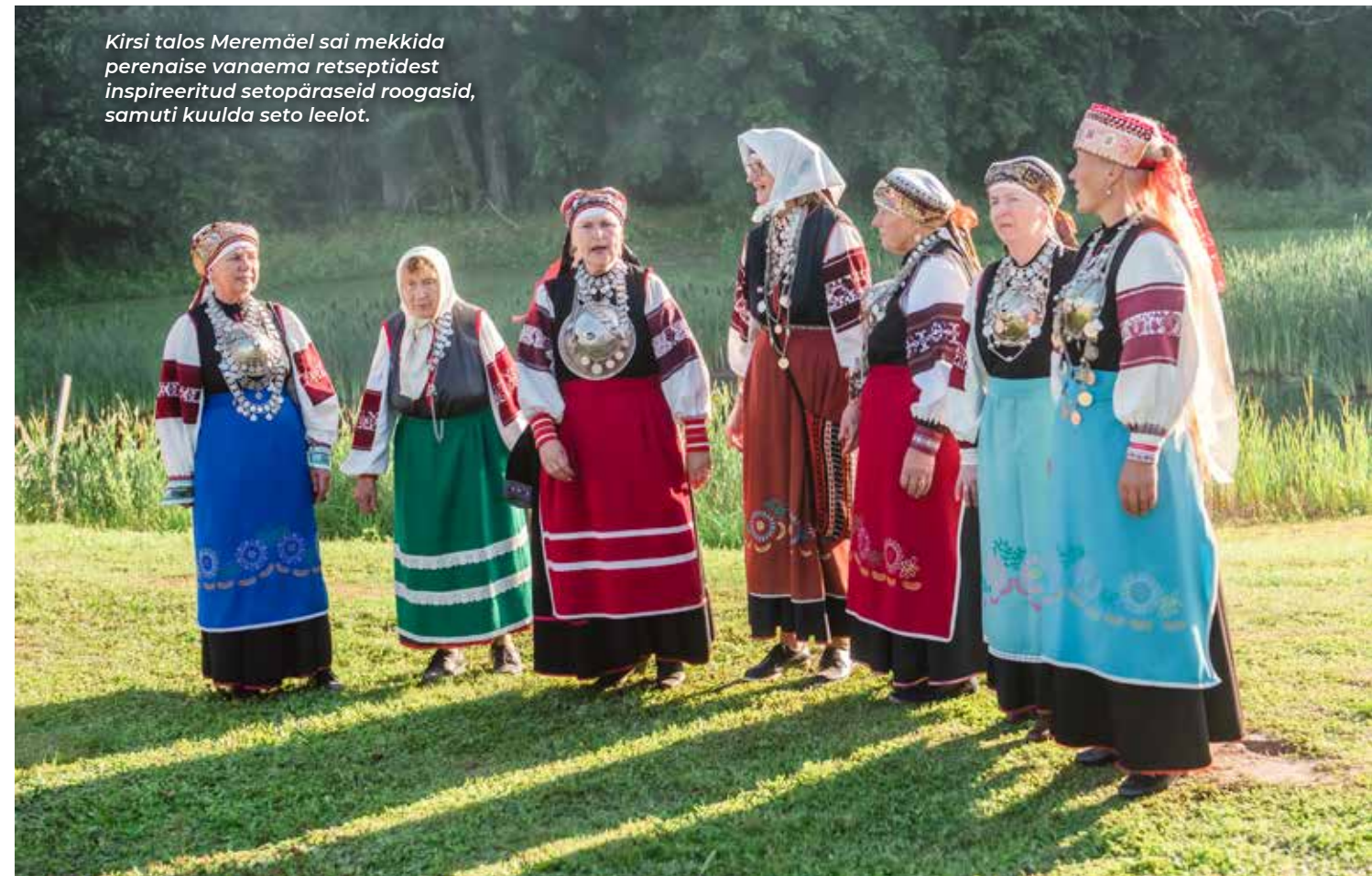
Kirsi talos Meremäel sai mekkida perenaise vanaema retseptidest inspireeritud setopäraseid roogasid, samuti kuulda seto leelot.

Nii nagu Tartu 2024 Lõuna-Eesti kogukonnaprogramm tervikuna, nii on ka selle raames aset leidvate toidusündmuste valik huvitav ja väärib eraldi käsitlemist. Enne konkreetsete sündmuste poole kiikamist peab aga ütleva, et inimeste huvid ja maitseed on kindlasti erinevad, kuid kultuuripealinn just seda tähendabki – uute kohtumiste, kogemuste, maitsete paljusust, kus igaühele leidub midagi.