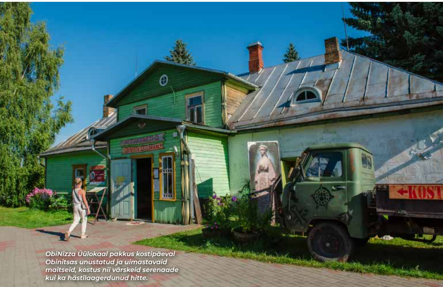
ObiNizza Üülokaal pakkus kostipäeval Obinitsas unustatud ja uimastavaid maitseid, kostus nii värsked serenaade kui ka hästilaagerdunud hitte.